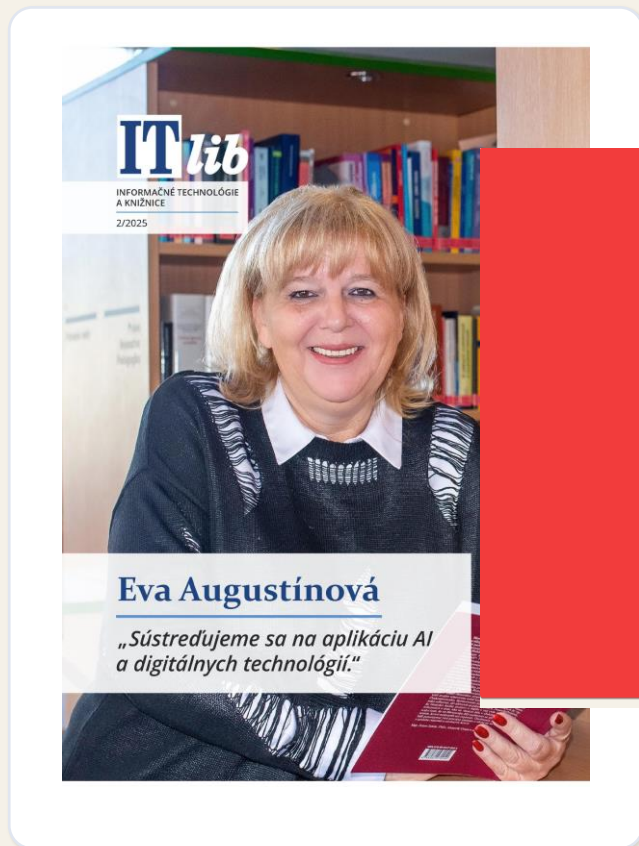
Koláž tituliek SEM

Popri článkoch prináša aj rozhovory s osobnosťami — hlas, pamäť a širší kontext odboru.